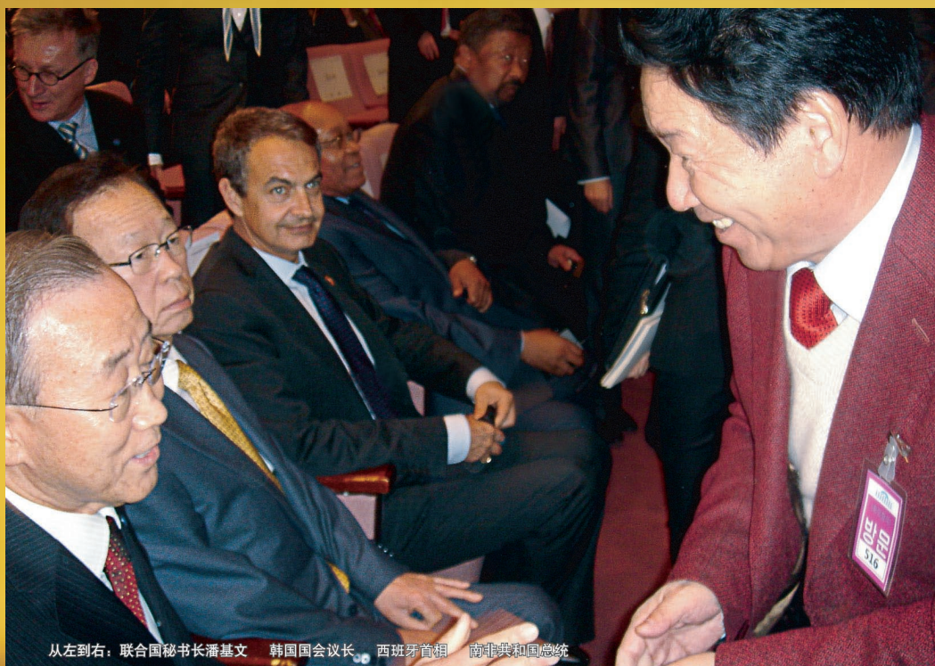
从左到右：联合国秘书长潘基文 韩国国会议长 西班牙首相 南非共和国总统