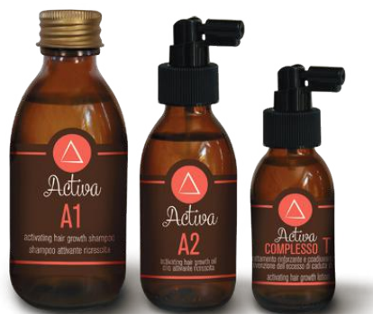
A1 A2 COMPLESSO T