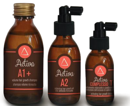
A1+ A2 COMPLESSO T