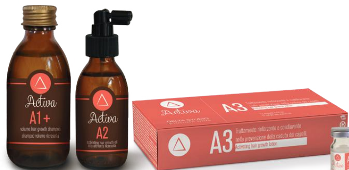
A1+ A2 A3