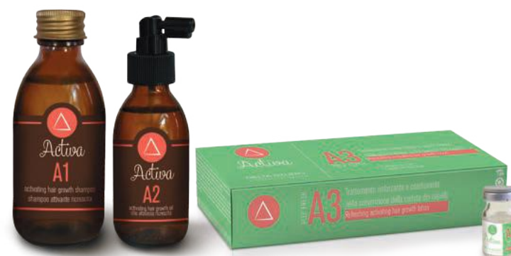
A1 A2 A3 DEEP FRESH