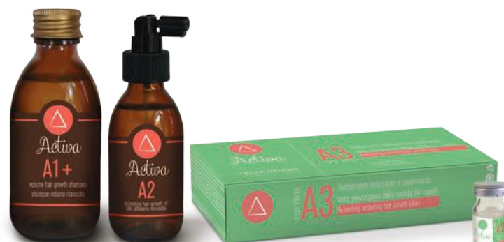
A1+ A2 A3 DEEP FRESH