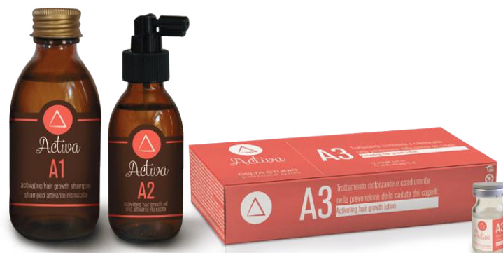
A1 A2 A3